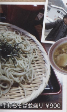
手打ちそば並盛り ¥900