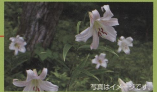
ささゆり群生地 6月中旬～7月上旬初夏に甘い香りを漂わせ、清楚で可憐なその姿は、気品があり、束の間の休息を与えてくれます。約1万本のユリを楽しめます。