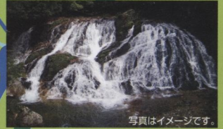
魚帰りの滝 サケなど魚が上がってきて、この滝を登る事が出来ず、滝の下に留まってしまい、またそこから戻っていった事からこの名が付けられました。秋には、紅葉との景色がすばらしく、紅葉ポイントです。また、釣りや野鳥観察のポイントでも知られています。