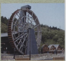
そばの里荘川 五連水車

日本最大級の五連水車が目印で、駐車場も広くて席もたくさん。新鮮なそばはびっくりするほど香りがいいです。サブメニューの野菜の天ぷらもおすすです。さらに、そば打ち体験(2,000円)もでき、家族でもカップルでも楽しめそーなスポットでもあります。