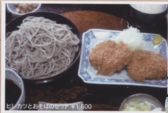
ヒレカツとおそばのセット ¥1,600