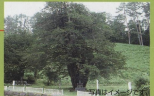
国指定天然記念物 治郎兵衛のイチイ 国天然記念物に指定されている「治郎兵衛のイチイ」は樹齢約2000年ともいわれ幹周囲は最大795cmもあります。昭和63年度環境庁の巨樹・巨木調査イチイの部で日本一となりました。