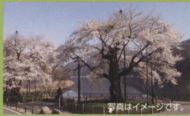
荘川桜 御母衣ダム湖岸に移植された樹齢450年と推定される2本のアズマヒガンザクラの古木で、岐阜県指定天然記念物。